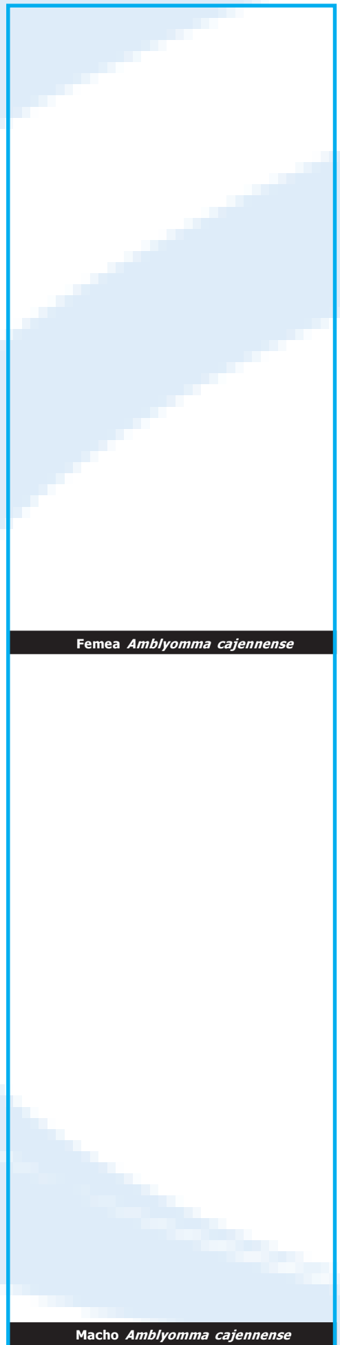
Femea Amblyomma cajennense

** Site consultado www.hc.unicamp.br/servicos/nve/doencas/febre_maculosa.htm