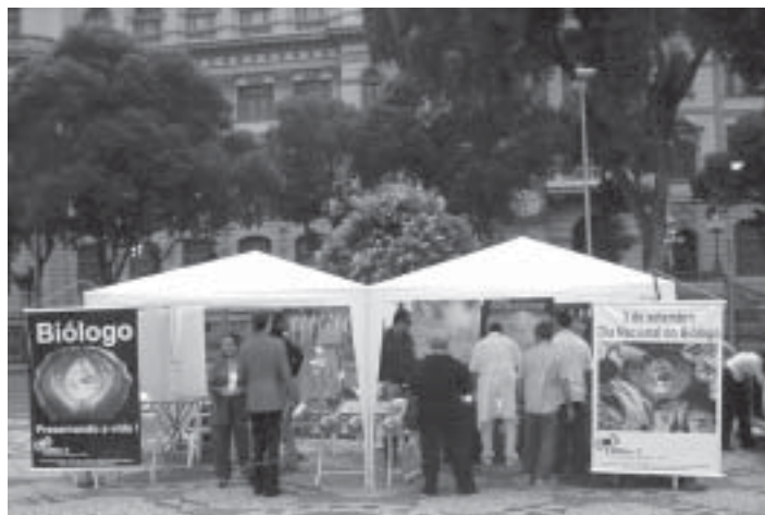
CRBio-2 montou duas tendas no Centro do Rio

Pelo Dia do Biólogo houve também a celebração de uma missa, às 10h, no histórico Convento de Santo Antônio, no Centro do Rio.