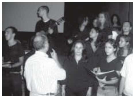
Coral da Universidade Veiga de Almeida - UVA abrilhantou o encerramento do XII ENBIO Encontro de Biólogos RJ/ES

O XII ENBIO confirmou o sucesso que o evento vem despertando a cada ano. Nos dias 4 e 5 de setembro, cerca de 400 pessoas, entre profissionais e estudantes de Biologia, além de representantes de importantes instituições, compareceram ao auditório da Petrobras, na rua General Canabarro (Tijuca), para debater importantes questões que permeiam as ciências biológicas hoje.