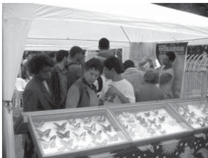
A Faculdade Maria Thereza - Famath montou caixas de insetos que chamaram bastante a atenção do público