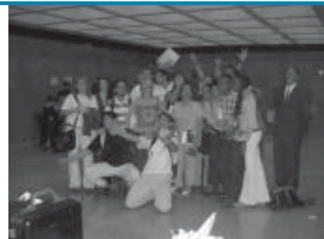
Descontração dos monitores no encerramento do evento.